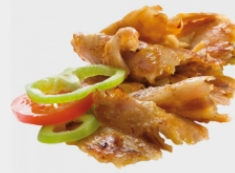
Alebon TK Gyros Hähnchen fertig geschnitten und gebraten, ohne Glutamat, je 1 kg Beutel