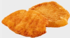
Edeka Food Service Classic Line TK Schweineschnitzel aus flüssig gewürztem Schweinelachs, paniert, roh, je 40x180 g Karton