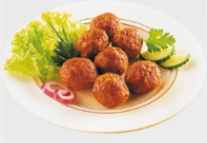
Sprehe TK Geflügel-Frikadellenbällchen ca. 20 g/Stück, je 3 kg Karton