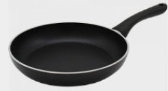
Karl Krüger Pfanne