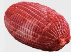
Laschori TK Hirschrollbraten sauber getrimmtes Nacken- bzw. Schulterstück, im Bratnetz, 4xca. 1,7 -2,5 kg Stück, je kg