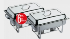
APS Chafing Dish