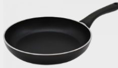
Karl Krüger Pfanne