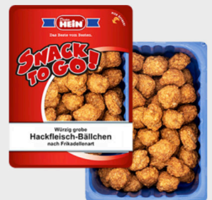
Hein Grobe Hackfleisch-Bällchen je 60x20 g Packung