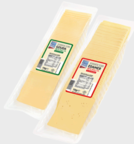
Edeka Food Service Classic Line Edamer oder Gouda in Scheiben