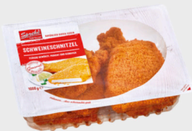
Sprehe Schweine-Schnitzel flüssig gewürzt, paniert, gebraten, je 1 kg Packung