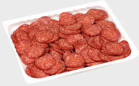
Henkelmann Peperonisalami je 500 g Packung