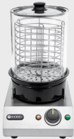
Hendi Würstchenwärmer "Hot Dog" Edelstahlgehäuse, Glaszylinder, Temperatur stufenlos regelbar, Ein-/Auswischer, Kontrollleuchte, 500 Watt, Maße: BxHxT 24x38,5x30cm, je Stück