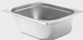
Hendi Kitchen Line GN1/2- Behälter

Höhe:10 cm, Füllmenge: 6,5 Ltr., je Stück