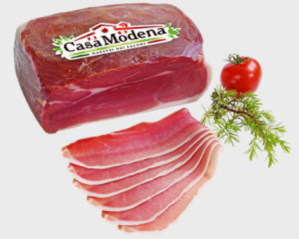
Casa Modena Landschinken Marco Polo ca. 2 kg, je kg