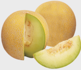
Spanien Galia Melone*

Entdecken Sie Highlights und interessante Angebote in unseren Kompetenzflyern IMPULSEIS und EIS & dazu!