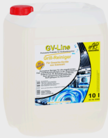
Assindia Grillreiniger GV-Line 10l je 10Ltr.Kanister