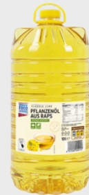
Edeka Food Service Classic Line Pflanzenöl aus Raps