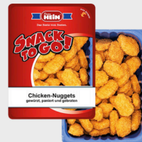
Hein Chicken Nuggets je 35x25g Packung