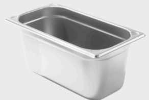
Hendi Kitchen Line GN1/3- Behälter

Höhe: 10cm, Füllmenge: 4,0 Ltr., je Stück