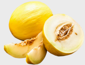
Brasilien Gelbe Honigmelone*