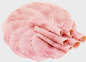
Echt Gut Hinterkochschinken ohne Schwarte natur, geschnitten, je 500 g Packung