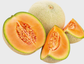
Spanien Cantaloupe Melone*