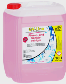
Assindia Fliesen-&Sanitärreiniger GV-Line je 10Ltr.Kanister