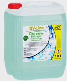
Assindia Apfelessigreiniger GV-Line je 10Ltr.Kanister