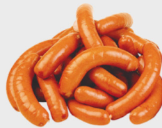
Echt Gut Bockwurst vac., je 10x100 g Packung