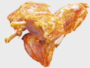
Echt Gut Mini Haxe gegrillt, 6x ca. 125 g, je kg