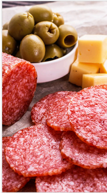
Pfiffetaler "Ahle Wurst" im Seidendarm je kg